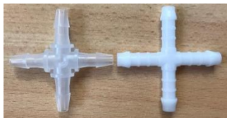
Ancien composant (gauche) et nouveau composant (droite)

Bien qu'il n'y ait aucune indication ou probabilité apparente qu'un copeau puisse se déplacer de l'irrigateur à l'endoscope lorsqu'il est connecté à l'EDS8, nous souhaitons corriger ce défaut et les irrigateurs actuellement sur le marché seront remplacés par des irrigateurs mis à jour et fabriqués avec une nouvelle conception du composant X, gratuitement.