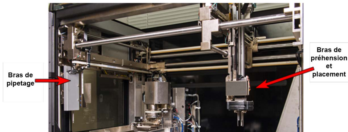
Figure 1. Emplacement du bras de pipetage de l'appareil Tomcat

L'enquête d'Hologic a trouvé la source du problème qui est lié à une anomalie logicielle qui, dans certains cas rares, peut toucher le fonctionnement du bras de pipetage de l'appareil Tomcat (figure 1) faisant en sorte que la position de l'embout de la pipette échantillon est légèrement plus basse que la position normale. Lorsque cela se produit, un code d'erreur 18 pourrait s'afficher ou un cliquetis ou un bruit de raclage pourrait se faire entendre en raison du contact de l'embout de pipette échantillon avec le plateau de support de protection des échantillons (figure 2)