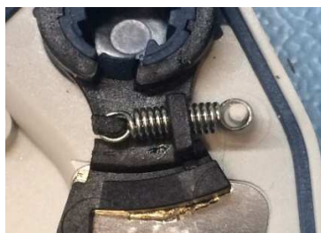
Ancienne plaque arrière