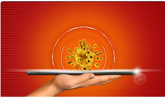
COVID-19 - Médicaments et dispositifs médicaux