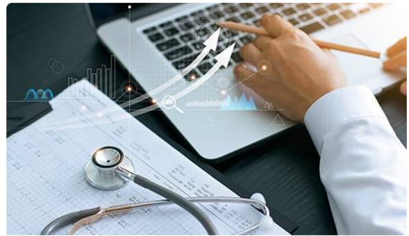
COVID-19 - Vos démarches durant la pandémie