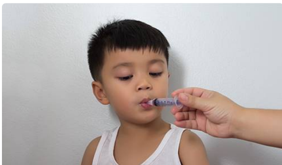
Formes de médicaments utilisés chez l'enfant et l'adolescent