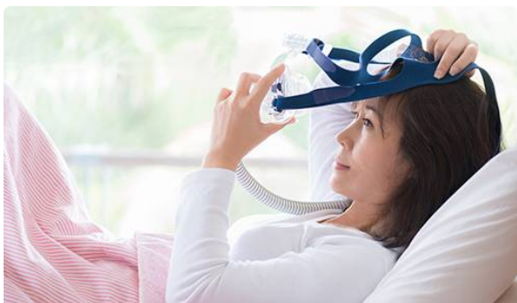
Appareils de ventilation Philips

Le compte-rendu de la réunion du 4 février 2025 sera publié prochainement.