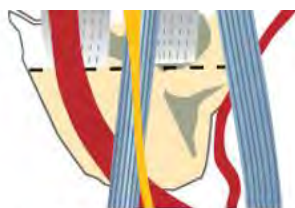
Figure 6. Nerf radial et branche profonde de l'artère radiale

La figure 2 fait partie des consignes de technique chirurgicale pour une opération CMC I. Il y a un addendum à ces consignes concernant la taille correcte de l'implant et l'utilisation des instruments de dimensionnement RegJoint™. Le diamètre optimal de l'implant couvre les bords corticaux de l'os, sans toutefois les dépasser de manière significative. L'épaisseur de l'espace réséqué doit être suffisante pour ne pas compromettre la structure poreuse de l'implant après l'implantation. Un bon conseil est de ne pas tirer le pouce pendant l'utilisation de l'instrument de dimensionnement.