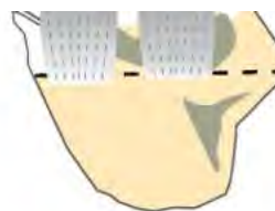
Figure 7. Lignes de résection