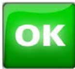
Figure 1. Icône OK

N'utilisez pas l'autorisation de l'irradiation par ExacTrac via l'ADI comme mesure de sécurité pour assurer le positionnement correct du patient avant le traitement.