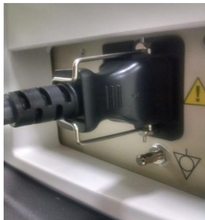
Emplacement du câble d'alimentation à l'arrière de l'unité.

Si l'extrémité côté système du câble d'alimentation (voir image ci-dessous) est endommagée, cessez toute utilisation du système jusqu'à ce qu'un câble de rechange soit fourni. Si vous rencontrez des problèmes d'alimentation avec votre unité, cessez toute utilisation du système et contactez GEHC Service.