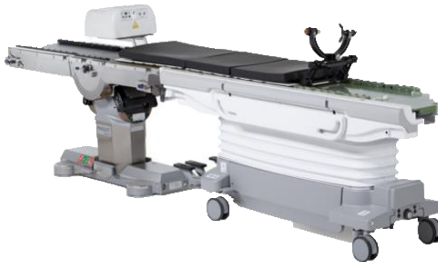
Figure 1 Table chirurgicale RM GE (à droite) arrimée à la table chirurgicale Maquet Magnus et munie d'un dossier de table 1150 (à gauche), concernés par la présente action corrective

Ce problème peut provoquer un dysfonctionnement imprévu du mécanisme de transfert du patient, permettant de déplacer le patient de la table chirurgicale RM GE à la table chirurgicale Maquet Magnus. Cela risque de retarder la manipulation et la prise en charge du patient pendant les interventions chirurgicales. GE a reçu des réclamations liées à une planche de transfert ne se dégageant pas de la table chirurgicale RM GE, ce qui empêche son déplacement de cette même table à la table chirurgicale Maquet Magnus. Aucune blessure n'a été signalée pour ce problème.