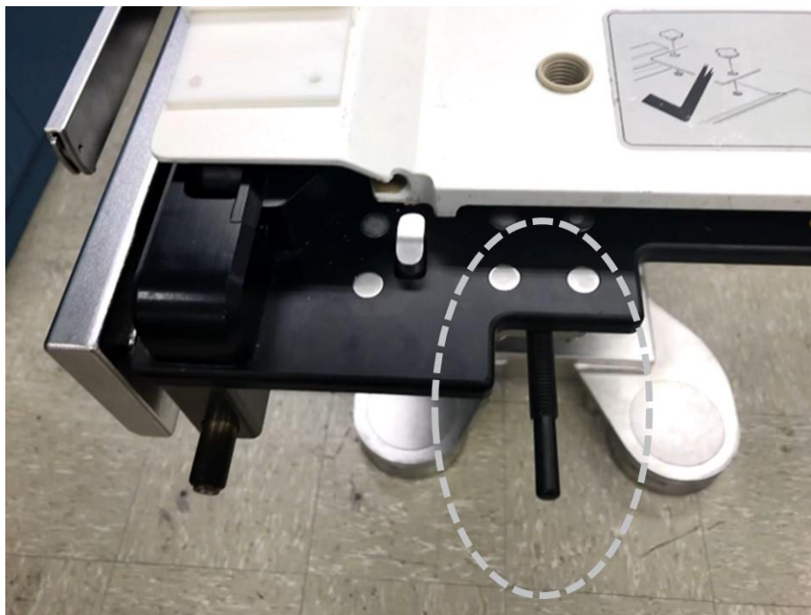
Figure 3 Broche placée sur la table chirurgicale Maquet Magnus