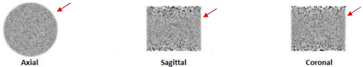
Figure 2 : TEP syngo VJ20B / Après solution de problème