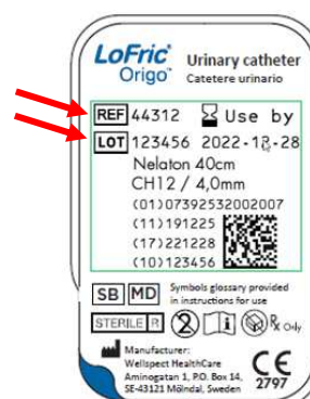
Étiquette de l'emballage individuel