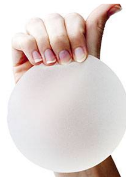
Implants mammaires PIP pré-remplis de gel de silicone