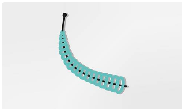
Surveillance de l'implant de stérilisation définitive Essure