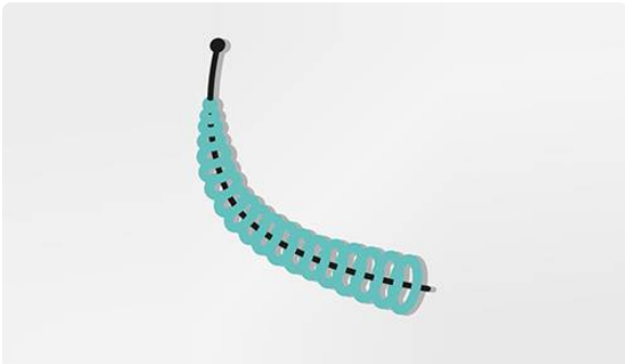
Surveillance de l'implant de stérilisation définitive Essure