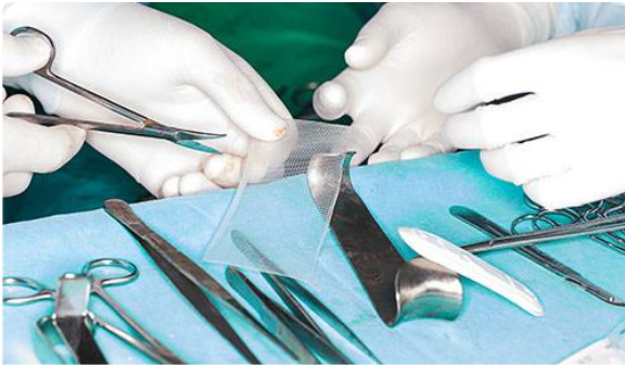
Surveillance des bandelettes sous-urétrales et implants de renfort pelvien