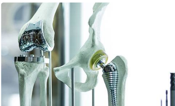
Surveillance des prothèses de hanche