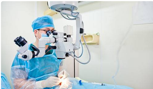
Les différentes techniques de chirurgie réfractive