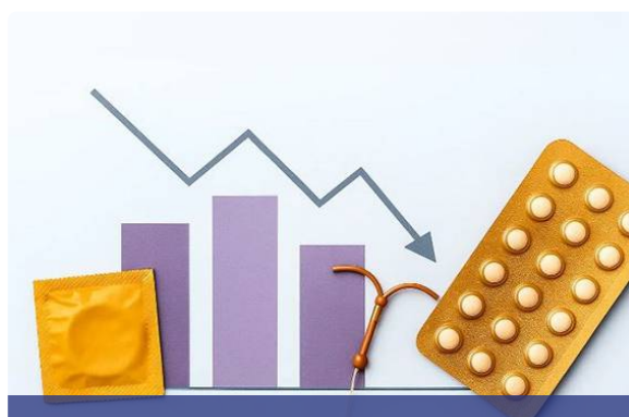
Utilisation des contraceptions hormonales en France : quelques chiffres