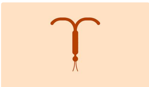
Dispositif intra-utérin (stérilet)