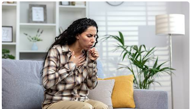
Le virus respiratoire syncytial (VRS)