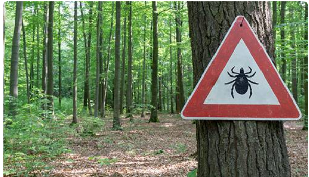
Maladie de Lyme