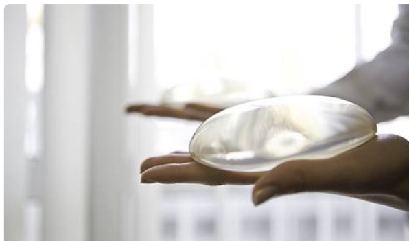
Dispositifs de surveillance des implants mammaires