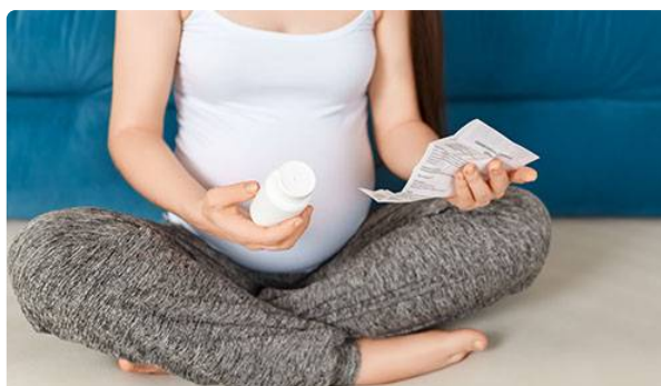
Médicaments et grossesse