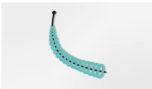
Surveillance de l'implant de stérilisation définitive Essure