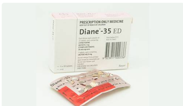
Diane 35 et ses génériques