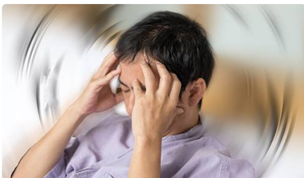
Androcur et risque de méningiome