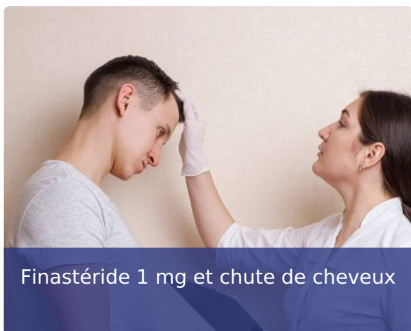
Finastéride 1 mg et chute de cheveux