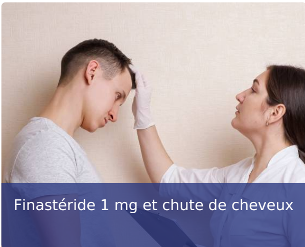
Finastéride 1 mg et chute de cheveux