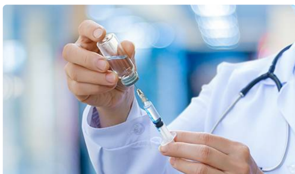
Situation des approvisionnements en vaccins