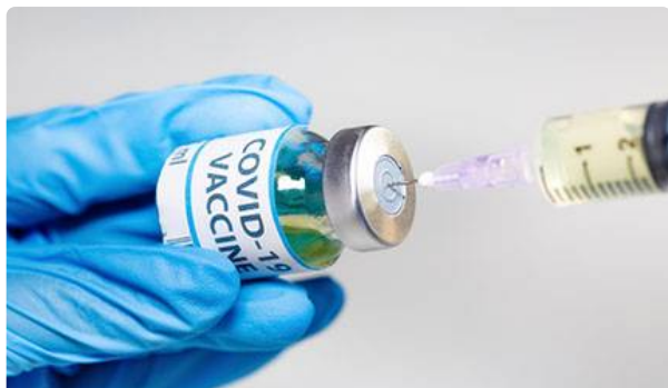
Vaccins contre le Covid-19