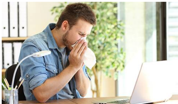
Vaccins contre la grippe