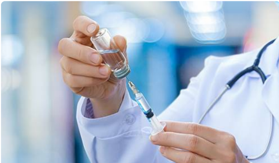
Situation des approvisionnements en vaccins