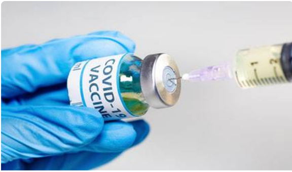
Vaccins contre le Covid-19