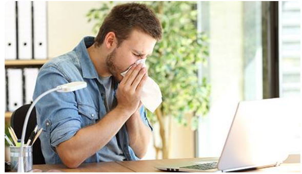
Vaccins contre la grippe