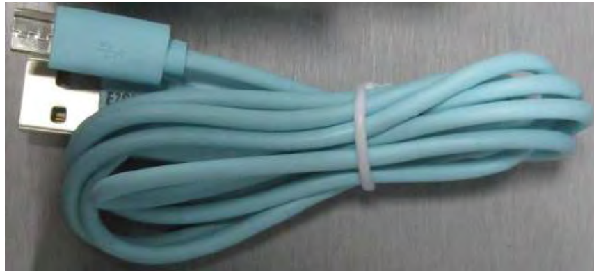
Figure 1 : Nouveau câble "intelligent"