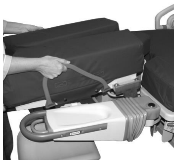
Fig. 1 : section pieds Lift-Off

Hillrom a identifié 1 096 lits spécifiques pour lesquels, si le mécanisme du loquet de la section pieds Lift-Off du lit d'accouchement Affinity® Four est endommagé, cela pourrait entraîner un engagement incorrect de la section pieds installée sur le lit. Voir la Figure 1 ci-dessous pour l'image de la section pieds Lift-Off.