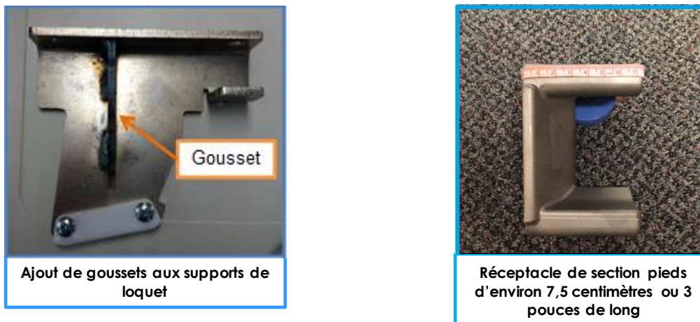
Fig. 3 : nouveau support de loquet avec gousset et réceptacle de section pieds plus long

Les supports de loquet (en rouge sur les photos) peuvent être pliés si la section tombe. Assurez-vous qu'ils sont droits, qu'ils ne sont pas pliés sur le côté et qu'ils s'insèrent correctement dans les réceptacles (bleus).