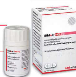
Boîte couleur ROUGE