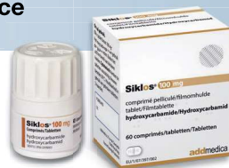
Boîte couleur OR