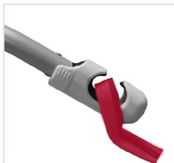
La boucle est positionnée dans le crochet.