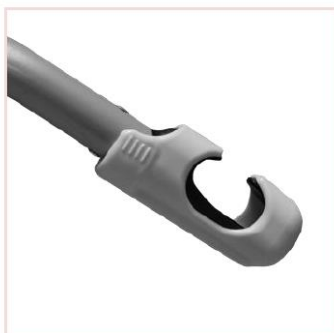
Le crochet SLS est ouvert.