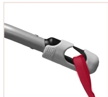
Un simple appui sur la bague permet de la verrouiller. Le crochet SLS est ainsi sécurisé.