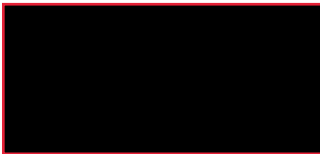
Vigilance Specialist Hamilton Medical AG

Nous vous remercions de votre soutien et vous prions de nous excuser pour la gêne occasionnée.