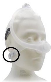
Figure 2 : masque nasal DreamWisp