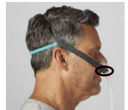
Figure 5 : masque de traitement 3100 NC/SP