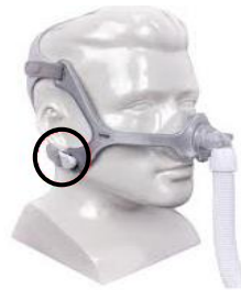
Figure 4 : masques nasaux Wisp et Wisp Youth