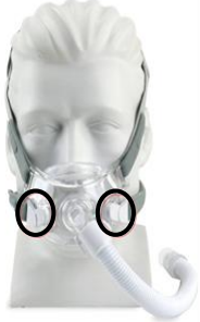
Figure 1 : masque facial Amara View

Les images des masques concernés sont présentées ci-dessous. Les clips magnétiques des harnais de ces masques sont entourés. Ces images peuvent servir de référence pour déterminer si votre masque ou celui de votre patient utilise également des clips magnétiques pour harnais. Ces masques sont destinés à fournir aux patients une interface pour l'application d'une thérapie par PPC ou à deux niveaux de pression. Les références des masques concernés et des composants des masques contenant des aimants sont répertoriées dans la figure 6.