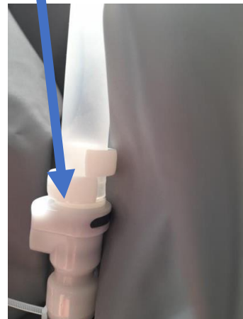
Vue de devant