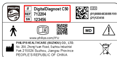
Figure 2 : exemple de numéros de modèle et de série DigitalDiagnost

Reportez-vous à l'annexe B pour obtenir la liste des modèles et numéros de série concernés. Pour déterminer si votre produit est concerné, consultez l'étiquette sur le système (voir la figure 2).