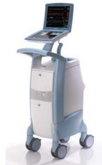
- CARDIOSAVE Hybrid -