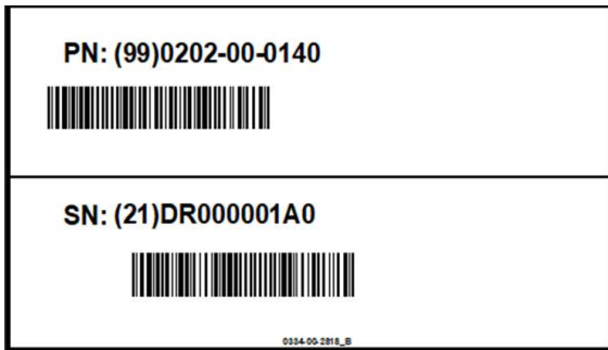
Etiquette de l'emballage du disque de sécurité