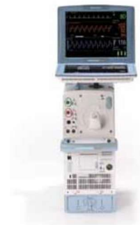
- CARDIOSAVE Rescue -