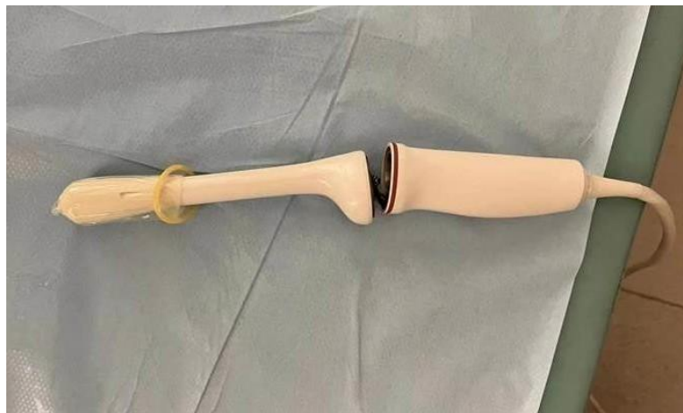
Figure 1 : Problème de liaison de la sonde

Philips a reçu des plaintes liées à ce problème. Cependant, aucun blessé ou dommage grave n'a été signalé.