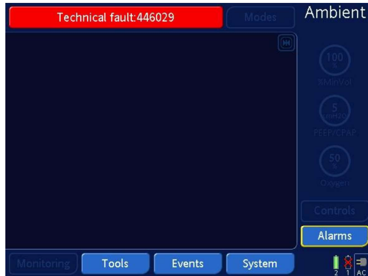
Figure 1 : L'écran affiche « État Ambient » et un message rouge avec un numéro de défaut technique (ceci est un exemple, un numéro de défaut technique différent peut être affiché)

À l'« État Ambient », le ventilateur déclenche une alarme sonore et visuelle et affiche l'écran suivant :