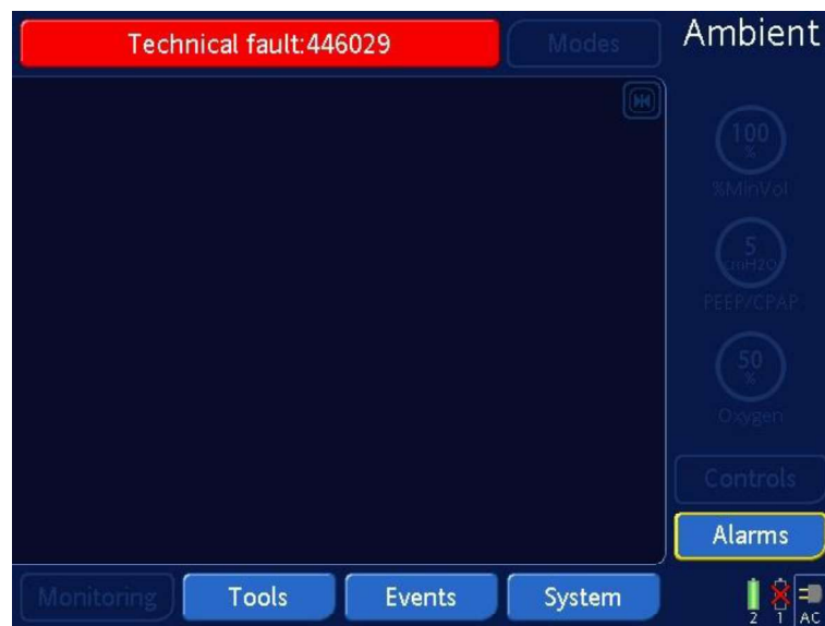
Figure 1 : L'écran affiche « État Ambient » et un message rouge avec un numéro de défaut technique (ceci est un exemple, un numéro de défaut technique différent peut être affiché)

À l'« État Ambient », le ventilateur déclenche une alarme sonore et visuelle et affiche l'écran suivant :