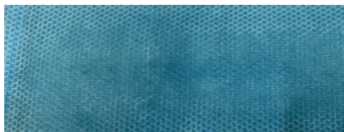
A. Produit conforme après friction humide