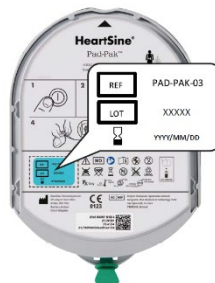
Figure 2 – Expiration du Pad-Pak