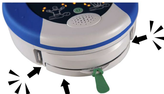
Figure 3 – Insérer un Pad-Pak

5) Vérifiez que le voyant d'état vert clignote pour indiquer que la procédure d'autotest initiale a été effectuée et que le dispositif est prêt à être utilisé.