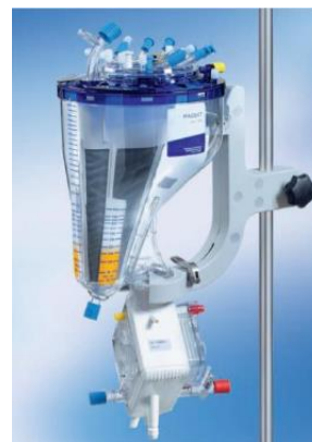
Figure 2 VKMO - Réservoir avec oxygénateur