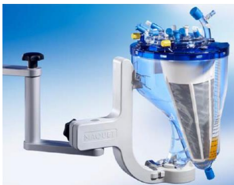
Figure 1 VHK - Réservoir

Le réservoir est utilisé pour recueillir, stocker et filtrer le sang jusqu'à six heures dans le circuit extracorporel pendant les opérations de by-pass cardio-pulmonaire chez les patients adultes, avec ou sans retour veineux assisté par aspiration. Il peut être intégré dans pratiquement tous les systèmes de perfusion. Le réservoir de cardiectomie veineux à coque rigide est uniquement destiné aux domaines d'utilisation indiqués. Ce réservoir peut également être utilisé en postopératoire comme réservoir de drainage et d'autotransfusion (par ex. pour le drainage thoracique) pour renvoyer au patient le sang autologue qui a été retiré du thorax pour l'échange de volume.