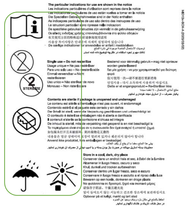
STERILE EO 0459 (IMAGE 2) INFORMATIONS CORRECTES version conforme

Cet avis de sécurité n'affecte en rien la sécurité ni les performances du dispositif MID-TUBE™, référence MID136 et MID130. En effet, les descriptions relatives aux logos manquants sont toujours présentes sous forme de texte (voir l'exemple ci-après).