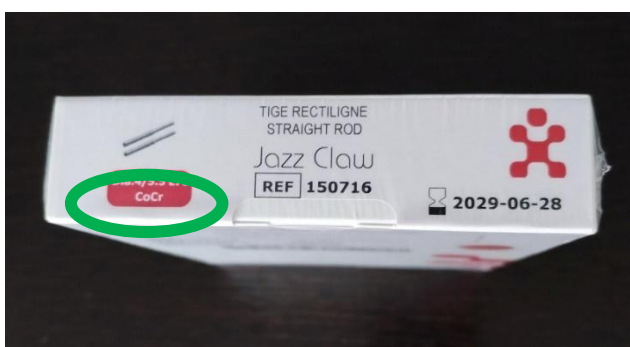
Étiquette latérale avec les informations correctes (voir cercle vert)