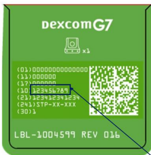
Figure 1: G7 Wearable Outer Box Label – Side 1